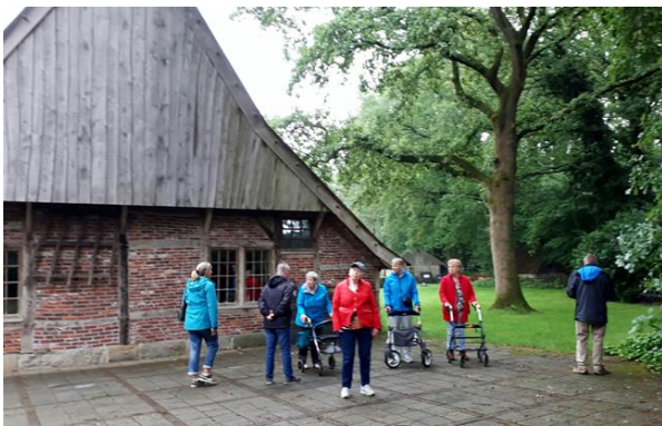
Daar nemen we ons toetje nog. Koffie of een ijsje.