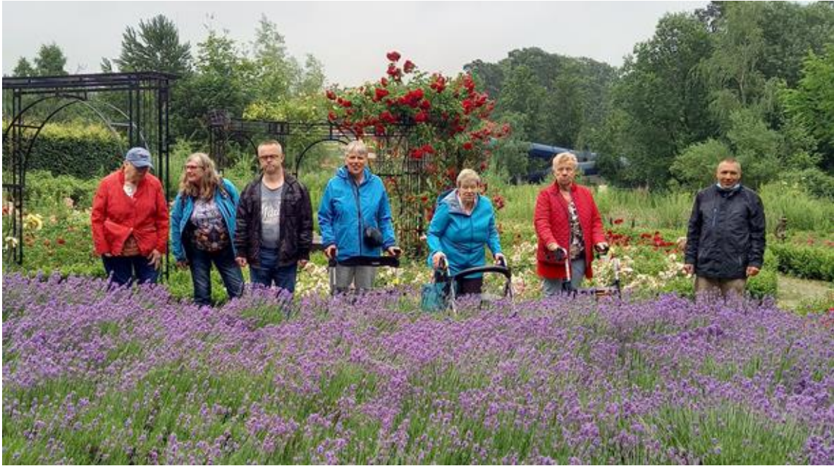
Mooie oude huizen en een prachtige tuin.