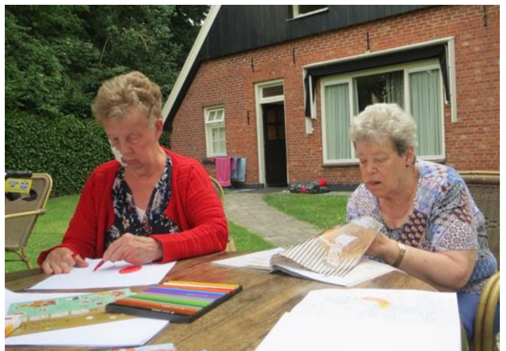
getekend en gekleurd