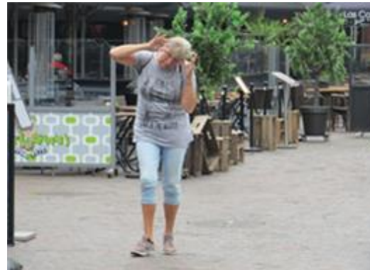
Anjo gaat even informeren voor de lunch van morgen.

's Middags bij de boerderij doen we weer rustig aan. Het is natuurlijk wel vakantie.